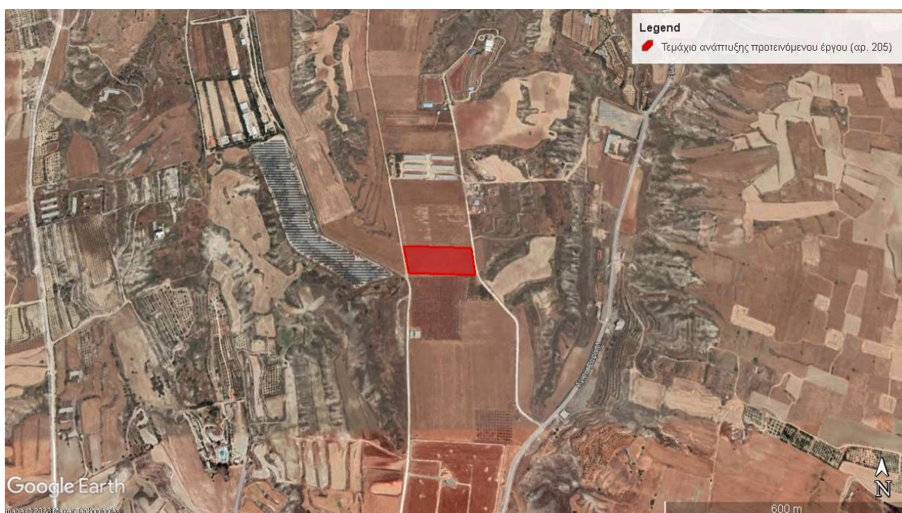
Εικόνα 1: Τεμάχιο ανάπτυξης πτηνοτροφικής μονάδας

Στην Εικόνα 1 παρουσιάζεται δορυφορική λήψη του τεμαχίου ανάπτυξης του προτεινόμενου έργου και της ευρύτερης περιοχής.