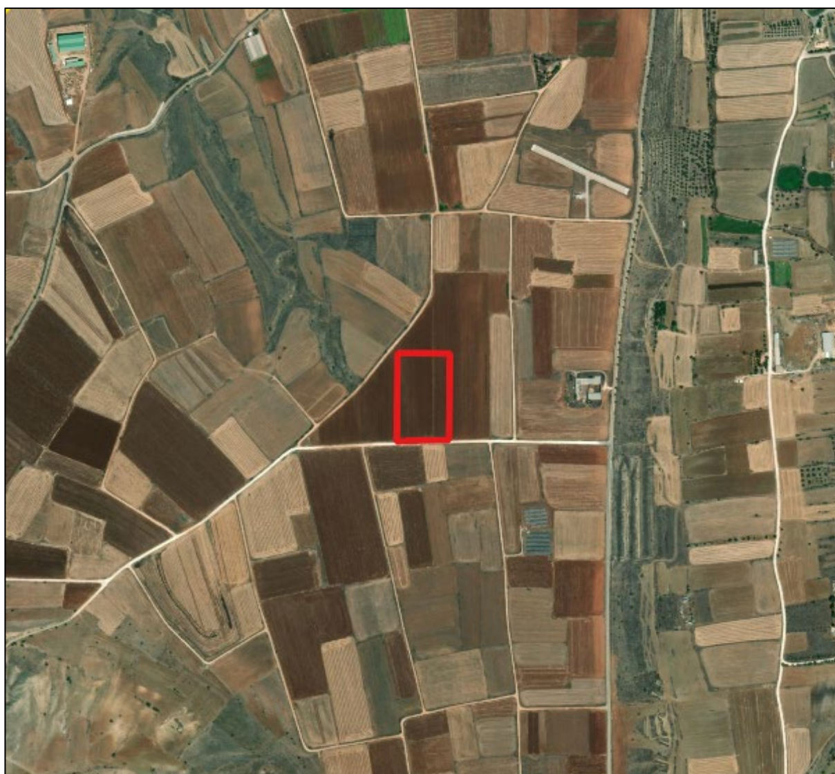
Εικόνα 1: Τεμάχιο ανάπτυξης πτηνοτροφικής μονάδας

Στην Εικόνα 1 παρουσιάζεται δορυφορική λήψη του τεμαχίου ανάπτυξης του προτεινόμενου έργου (με κόκκινο χρώμα) και της ευρύτερης περιοχής.